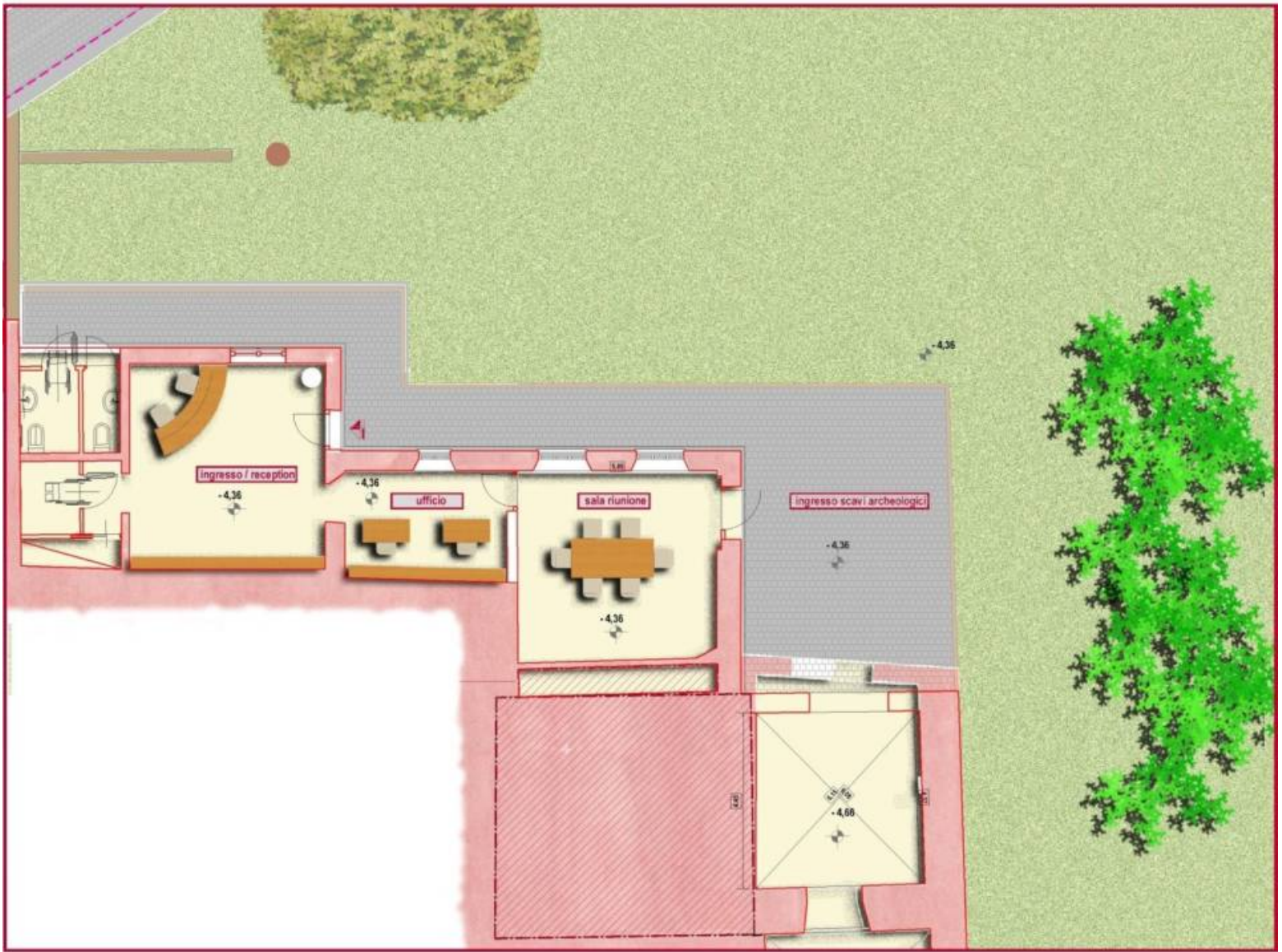
Frascati, partono i lavori al Parco Archeologico di Cocciano