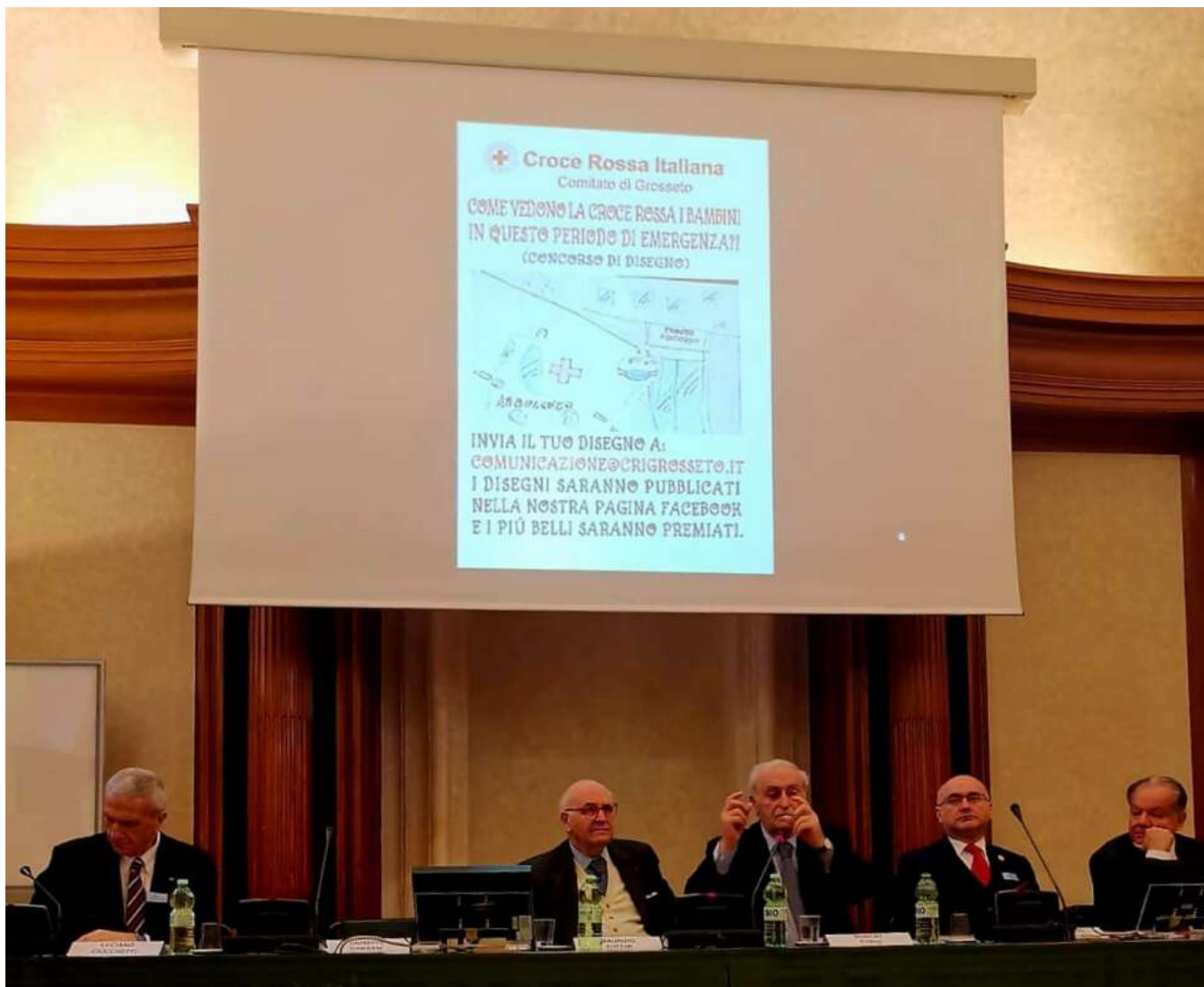
La premiazione al Senato