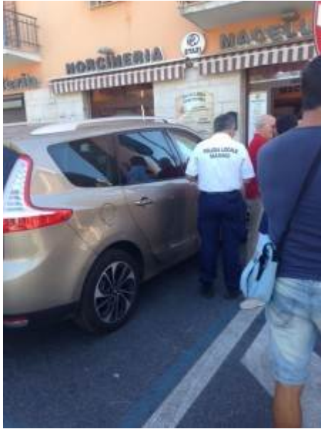
La Polizia Locale e la Protezione Civile di Marino dopo intervento