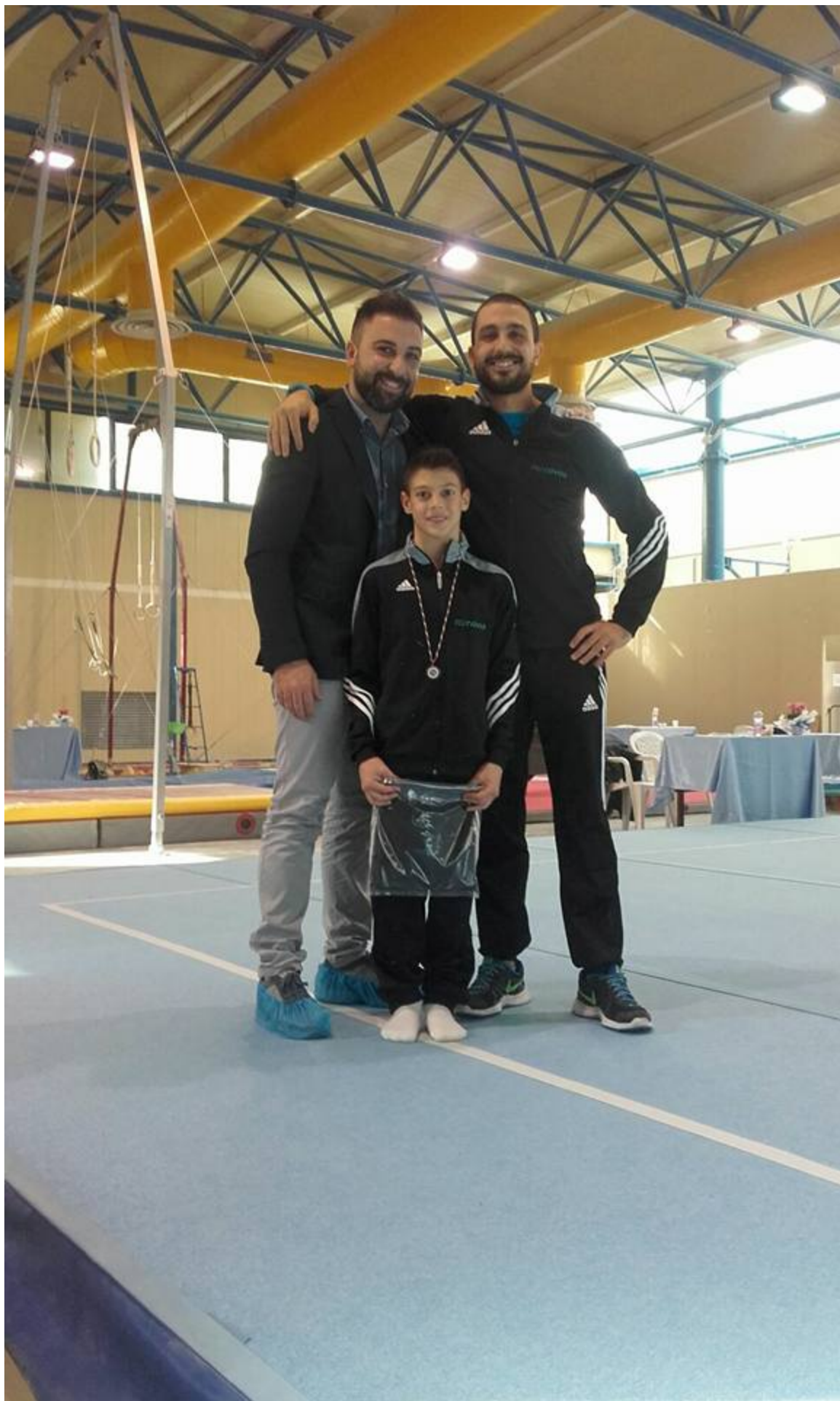
Asd Res Novae Velletri ai campionati Interregionali di categoria di