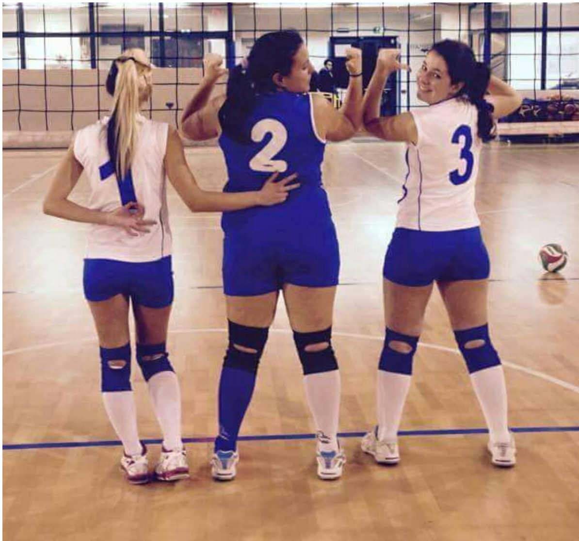
Albano Laziale, il punto sull'attività dell'Albalonga VBC