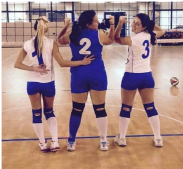
Giocatrici dell'under 12 dell'Albalonga Vbc

ALBALONGA VBC: L'under 12 femminile come fulcro del lavoro azzurro.