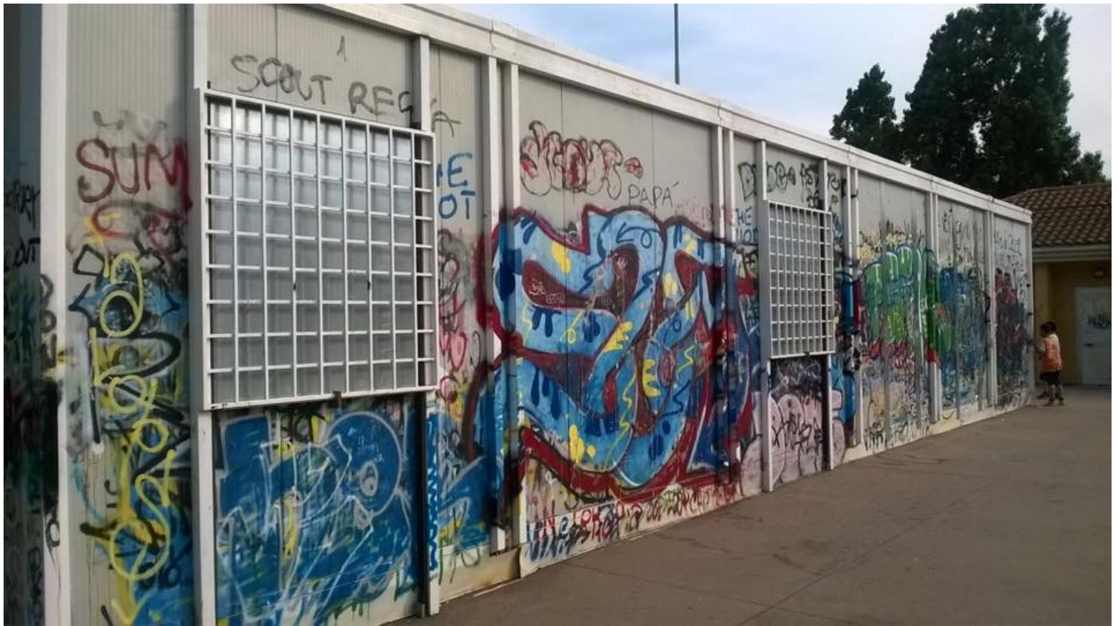
Ciampino, il bilancio del 2015 del Comitato Sicurezza locale