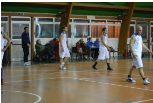
Colonna Basket entra in campo