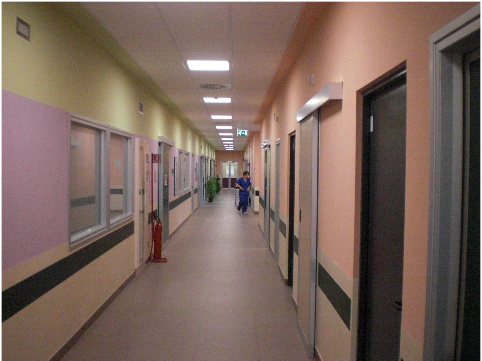
Pronto nuovo reparto di ginecologia e ostetricia dell'ospedale di Genzano