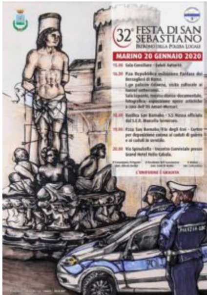
San Sebastiano 20 gennaio

Lunedì 20 gennaio: gli eventi in programma il giorno di San Sebastiano