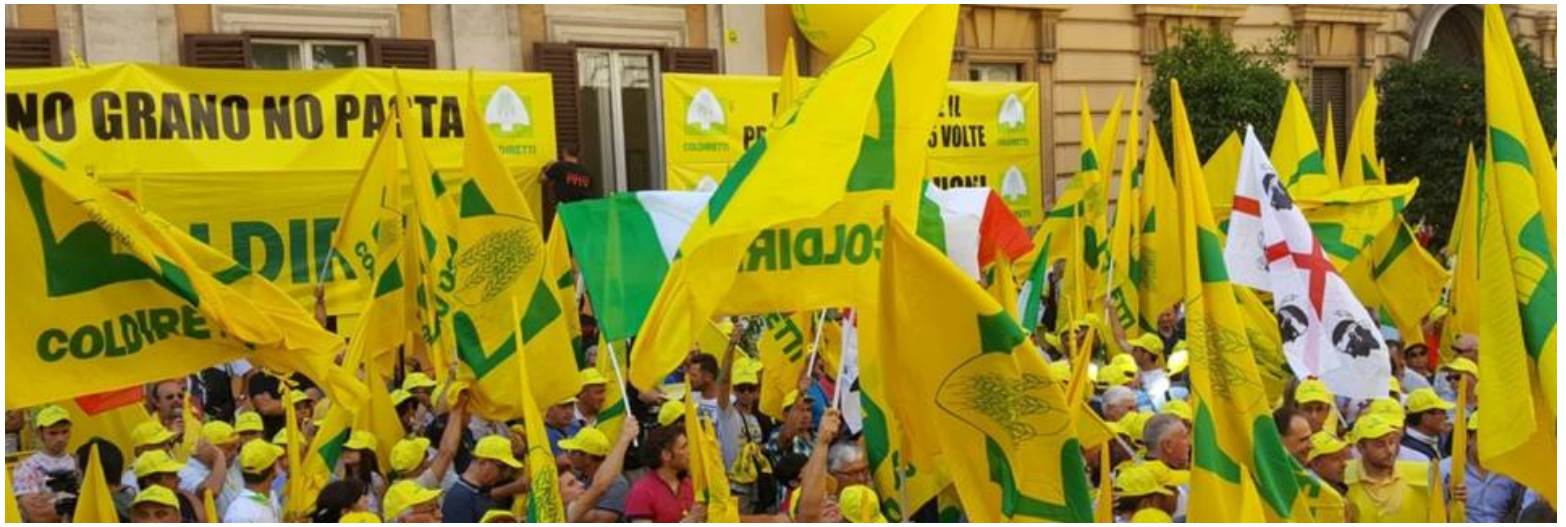
Maltempo, l'allarme di Coldiretti Lazio