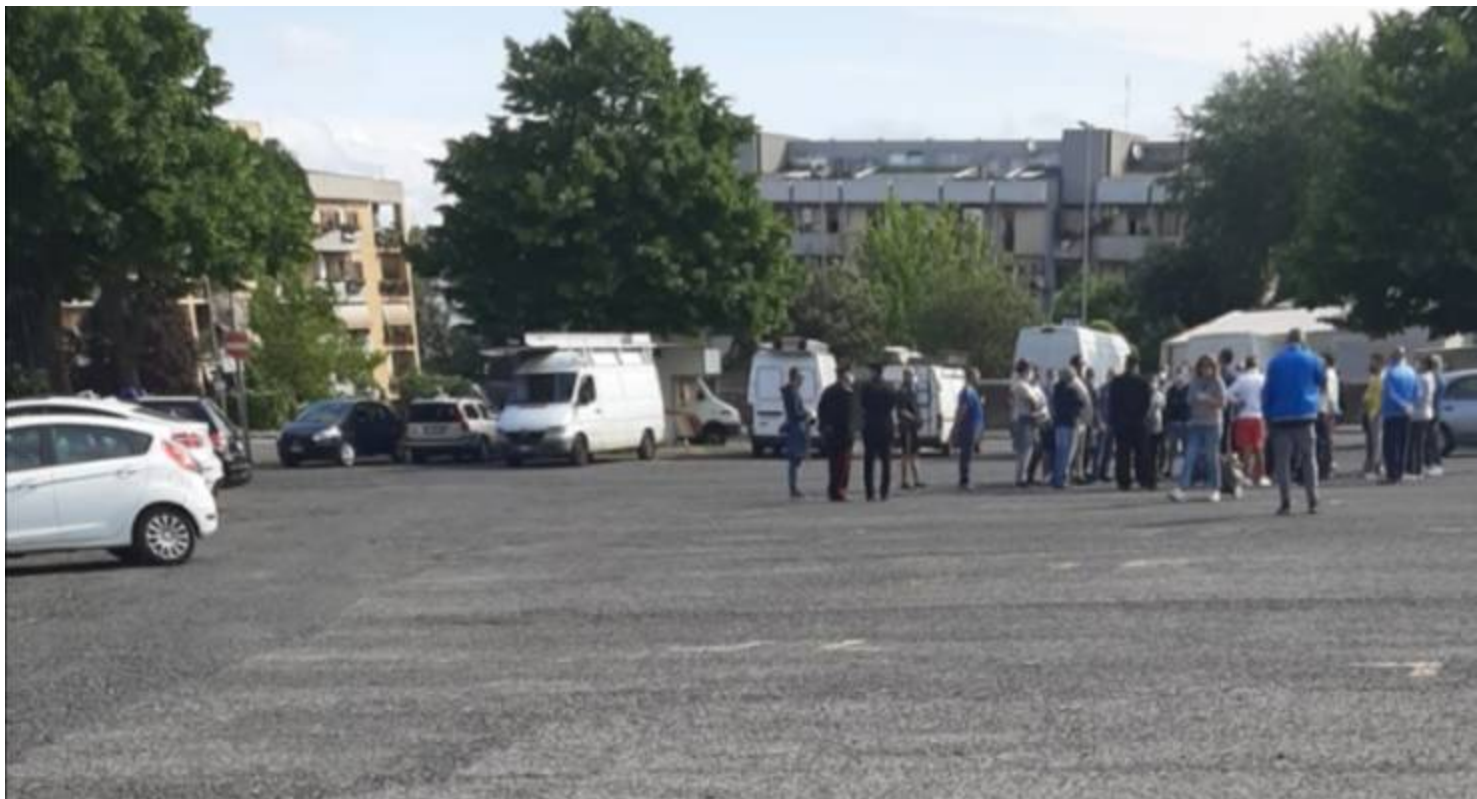
Confronto Mastrosanti e alcuni ambulanti

Oggi, mercoledì 20 maggio, è in corso di svolgimento il Mercato Settimanale di Cocciano. Alla luce dell'ordinanza n.100 del 18 maggio firmata dal sindaco Mastrosanti (vedi anche https://www.metamagazine.it/mercato-cocciano-il-20-maggio-solo-commercio-alimentare/ ) è possibile il commercio dei soli generi alimentari.