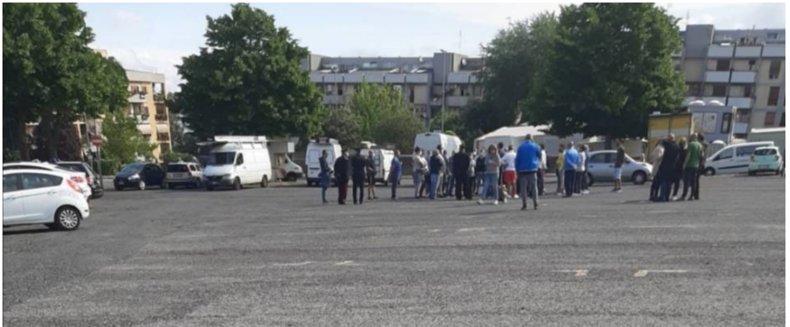
Mercato Cocciano, confronto tra Mastrosanti e alcuni ambulanti